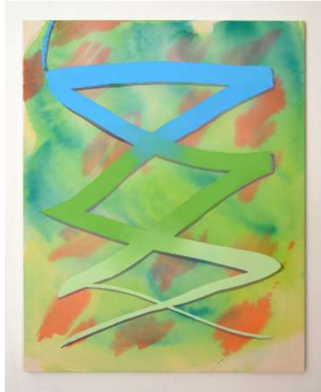
Hazel Ann Watling D'PAK & OPRAH 6 2020 aquarelle, encre et acrylique sur toile (coton) sur châssis, verniss à la bombe (UV protection mat) 10 x 80cm