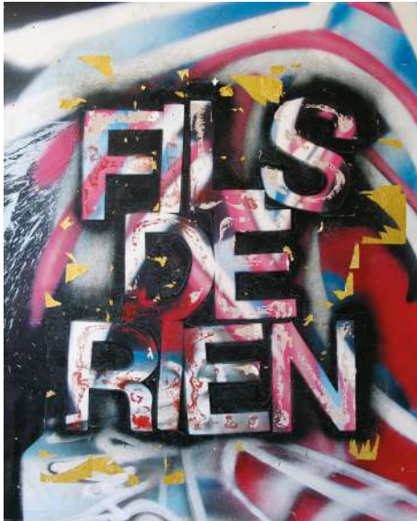
Karim Ghelloussi Fils De Rien 2018 95 x 77,5cm