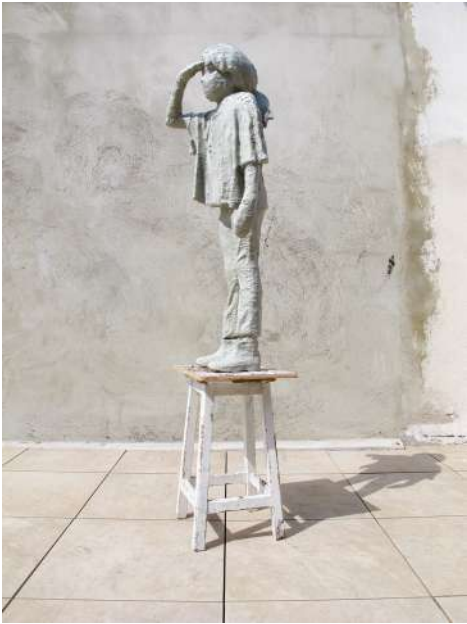
Karim Ghelloussi Sans-titre (La chase aux lézards) 2019 Résine & matériaux divers 180 x 40 x 40 cm