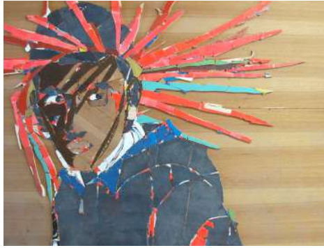
Karim Ghelloussi Le gars de Tébessa (Mémoire de la jungle) 2019 Chute de bois 146 x 175 x 4 cm