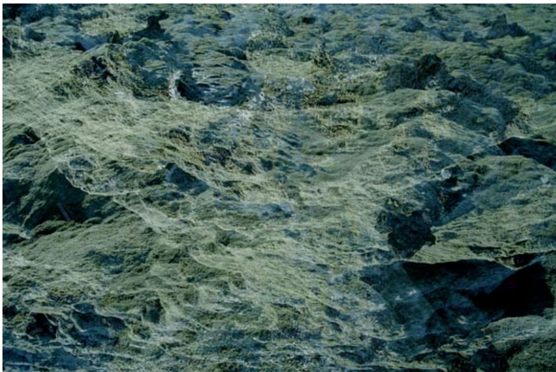
Orga IV , tirage pigmentaire sur papier baryté contrecollé sur aluminium, 2004. © Étienne de France