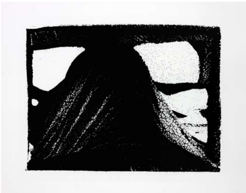
Sans titre, série Spectre (x30), projection d'un film instantané épluché, tirage argentique noir et blanc sur papier baryté, 47 x 57 cm, 2009-2010, IEX + IEA.